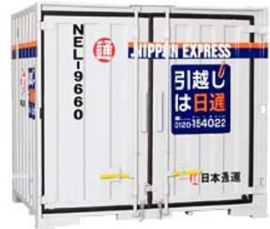
単身パックXの2トンコンテナ

「単身パックX」は、従来の単身者向け少量引越パック商品の「単身パックS（エス）」や「単身パックL（エル）」で積むことができなかった大型家財や自転車なども積載できるのが大きな特徴。また、鉄道輸送を利用した安価で環境にやさしい引越サービスとなっている。